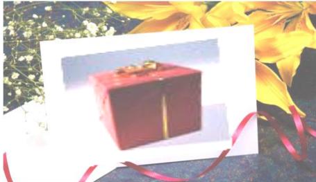
Gift تقديم الهدايا