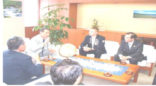
Names and Backgrounds الأسماء والخلفيات