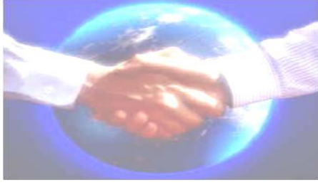
Good Conduct and Treatment المعاملة والسلوك الحسن