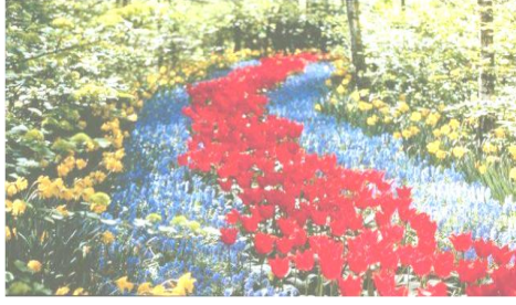
Love and Respect الحب و التقدير