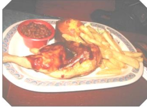
Helping, Serving, and Visiting others زيارة الآخرين ، تقديم المساعدة لهم و خدمتهم