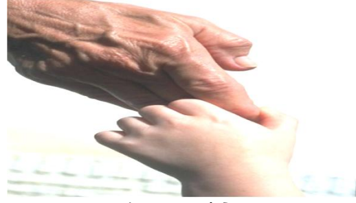
Love and Respect الحب و التقدير